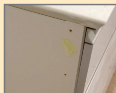
工事で誤って開けてしまった穴