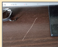
家具にできた引っ掻き傷